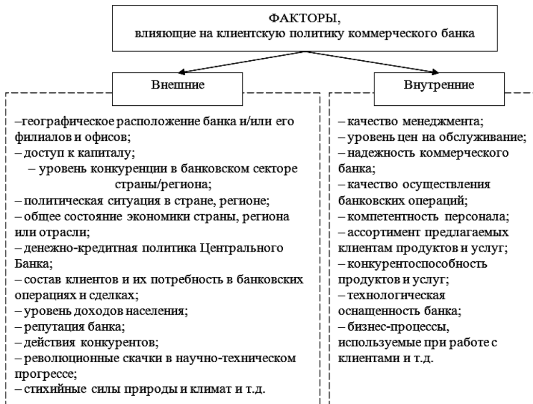
Рис. 1. Факторы, влияющие на клиентскую политику банка

Клиентская политика является важнейшей составляющей стратегии развития АО «АЛЬФА-БАНК» – крупнейший российский частный банк, входящий в топ-5 надежных банков России. Рассмотрим основные показатели деятельности банка (табл. 1).