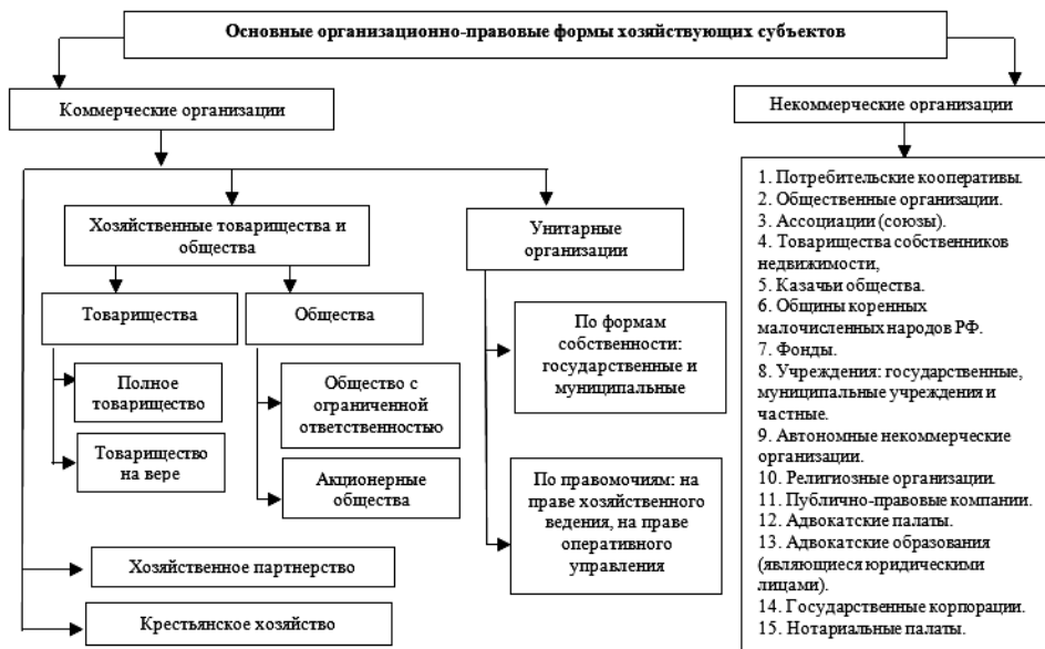
Рис. 1. Основные организационно-правовые формы хозяйствующих субъектов

Динамика изменения распределения общей численности предприятий и организаций по формам собственности за 2000-2018 гг. представлена в таблице 1.