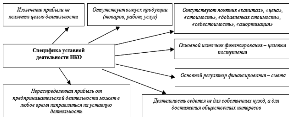
Рис. 3. Специфика уставной деятельности некоммерческих организаций

Особенности организации финансов некоммерческих организаций, как самостоятельных хозяйствующих субъектов определены целевой направленностью их уставной деятельности, порядка и источников финансирования. Специфика уставной деятельности некоммерческих организаций представлена на рис. 3.