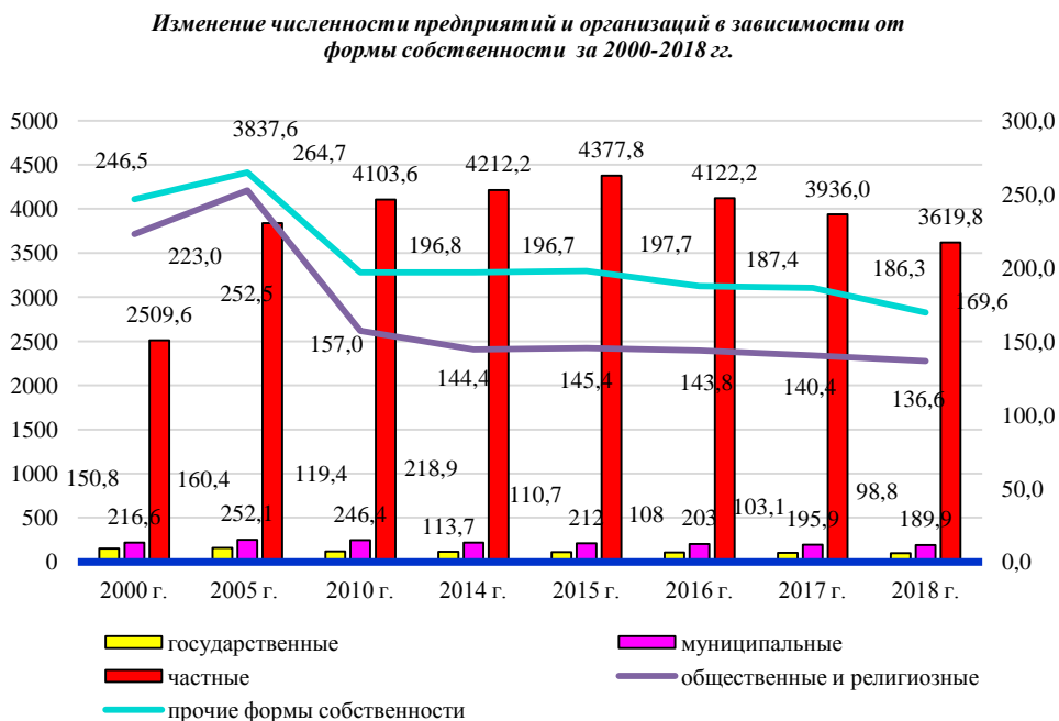
Рис. 2. Изменение численности предприятий и организаций в зависимости от формы собственности за 2000-2018 гг. [7]

В связи с этим, представим в графической форме статистику распределения предприятий и организаций по формам собственности за 2000-2018 гг. (рис. 2).