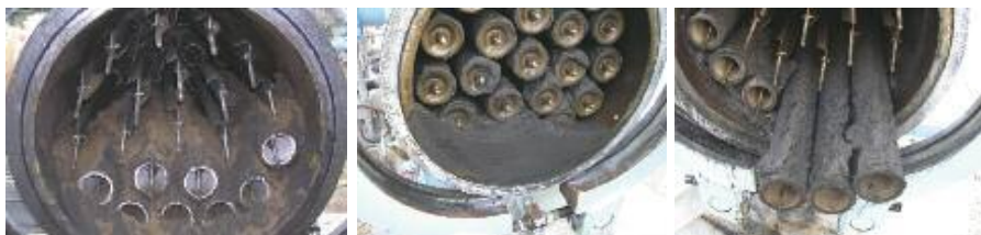
Рис. 5. Результаты испытаний фильтров/коагуляторов [2]

Результаты работы сепаратора показаны на рис. 5.