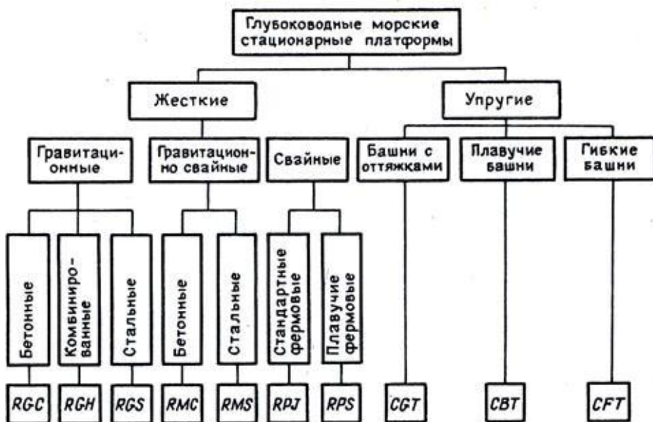
Рис. 1. Классификация глубоководных МСП

В последние годы, в связи с широким разворотом работ по освоению морских нефтяных месторождений в различных районах Мирового океана, предложен и осуществлен ряд новых типов и конструкций МСП. Эти типы и конструкции МСП различают по следующим признакам: способу опирания и крепления к морскому дну; типу конструкции; по материалу и другим признакам.