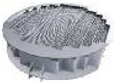
Рис. 4. Каплеуловитель волновой

Специально разработанная и произведенная PECO Facet технология вытяжки тумана Wave Plate Vane (каплеуловитель волновой) рис. 4. Ошибка! Источник ссылки не найден. , обеспечивает удаление капель жидкости. Уникальный «волновой» профиль лопастей волновой пластины создает усовершенствованный механизм разделения инерционных ударов, который обеспечивает высокую эффективность удаления и низкий перепад давления при одновременном сопротивлении засорению полутвердыми загрязняющими веществами. Лопасть волновой пластины создана для того, чтобы противостоять экстремальным нарушениям процесса, поскольку в ее конструкции используется больше опорных болтов, чем в других аналогичных конструкциях лопастей.