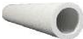
Рис. 2. Картридж фильтр/коагулятор

Модель картриджа РСН рис. 2 может быть в полиэфирной или полипропиленовой среде с микронными показателями 0,3, 0,5, 1, 5 и 10.