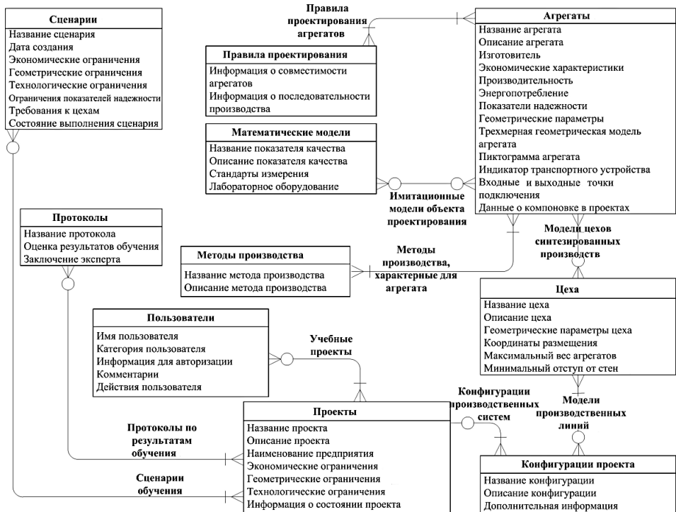
Рис. 1. Часть структуры информационного обеспечения

На рисунке 1 представлена часть структуры информационного обеспечения библиотеки макромоделей.