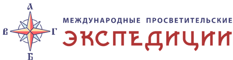
Рис. 1. Логотип проекта

Целью проведения международных просветительских экспедиций стала популяризация русского языка, литературы и российского образования в молодежной среде иностранных государств. Для этого предстояло решить задачи развития активных личностных инициатив молодых людей в вопросе изучения русского языка, а также повышения популярности и престижа русского языка и российского образования в молодежной среде иностранных государств.