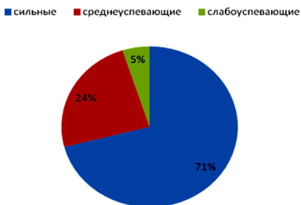
Рис. 3. Диаграмма. Показатели успеваемости студентов (в %)

По диаграмме видно, что преобладают «сильные» студенты (71%), «среднеуспевающих» - 24%, а «слабоуспевающих» всего 5%.