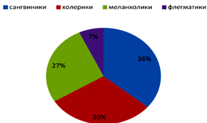
Рис. 1. Диаграмма. Типы темперамента у студентов (в %)

В ходе проведения опросника Айзенка были получены следующие результаты: у 11 студентов (31%) выявлен сангвинический тип темперамента, 9 студентов (26%) обладают холерическим типом темперамента, 8 студентов (23%) – меланхолическим и 7 студентов (6%) являются флегматиками (Рис. 1).